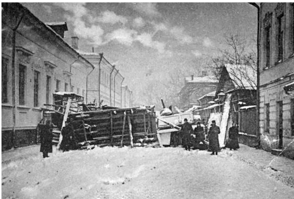
Баррикады на Большой Бронной во время Декабрьского восстания 1905 года в Москве